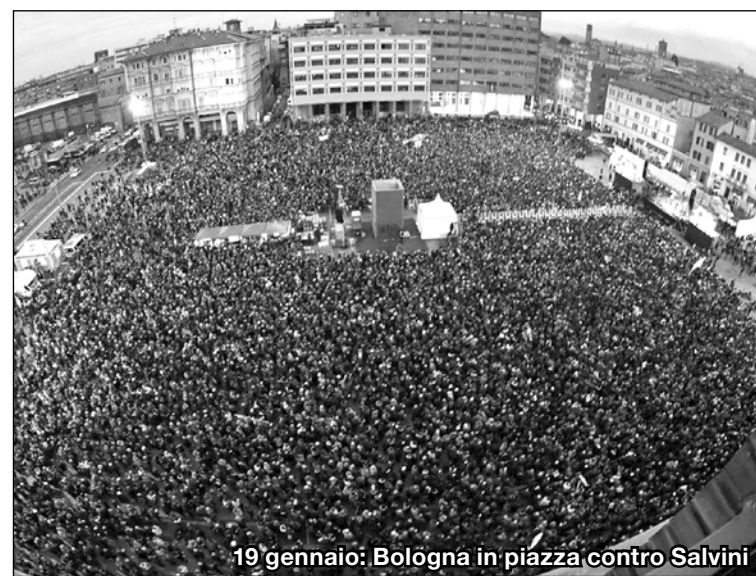
19 gennaio: Bologna in piazza contro Salvini

Il Partito democratico ottiene quasi 750mila voti (34,7%). Se sommiamo ad essi la lista del presidente (5,8%) i democratici superano il 40%, una percentuale che non raggiungevano dai tempi di Renzi nelle Europee del 2014. Emilia-Romagna Coraggiosa, la lista che ha raccolto la sinistra legata ai democratici