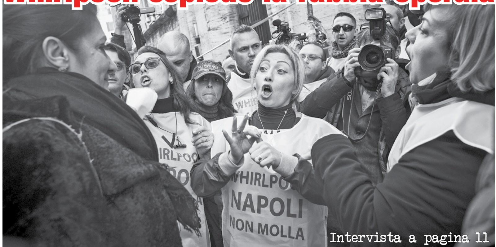
Intervista a pagina 11