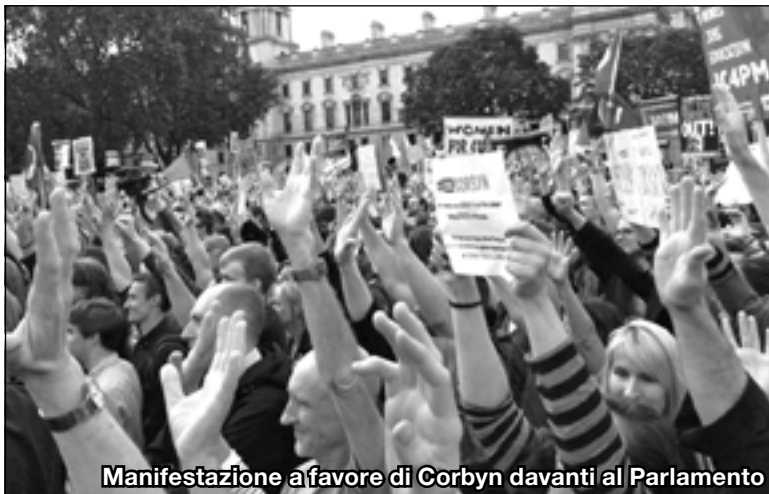
Manifestazione a favore di Corbyn davanti al Parlamento

Quanto visto finora è solo il preludio di nuove convulsioni. Nuove e profonde crepe si sono aperte nella classe dominante a livello internazionale e come sempre nella storia la crisi al vertice della società si lega alla lotta di classe e alla possibile apertura di situazioni rivoluzionarie. A livello internazionale il compito più importante è cogliere la radicalizzazione a sinistra (confermata in questi giorni dal movimento a difesa di Corbyn), farne la leva che rompa con l'illusione interclassista della riforma dell'Europa e costruire un fronte di classe che sulla base di una posizione nitidamente internazionalista e anticapitalista possa raccogliere il sostegno di quei settori popolari oggi illusi dalle sirene del nazionalismo.