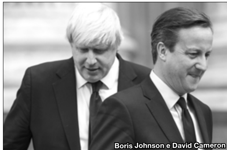
Boris Johnson e David Cameron

Un voto diviso e confuso, quindi. E come avrebbe potuto essere diversamente? In assenza di una chiara posizione indipen-