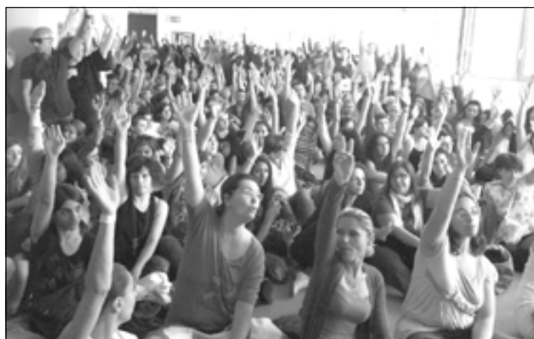
Assemblea dei lavoratori della Direct Line

L'annuncio della ristrutturazione è stato uno shock per i lavoratori che hanno da subito reagito con uno sciopero su più giorni che ha visto il 97% di adesione e una manifesta-