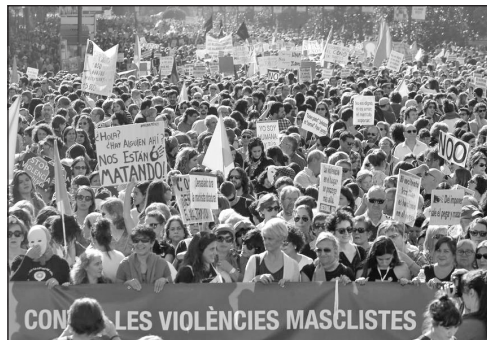
Madrid: corteo contro la violenza sulle donne

D'altro canto, questa risoluzione independentista del parlamento catalano, che contiene al suo interno una serie di riforme sociali progressive, non è altro che una trappola tesa alla Cup per costringerla a votare Artur Mas, il presidente uscente, responsabile diretto dei tagli e dell'austerità di questi ultimi anni. La Cup fino ad ora, ha giustamente negato il suo voto. JxS non ha la minima intenzione di applicare nessuna delle misure sociali incluse nella dichiarazione, stanno solo prendendo tempo per arrivare ad un patto coi loro amici di classe della borghesia spagnola, dopo le elezioni di dicembre.