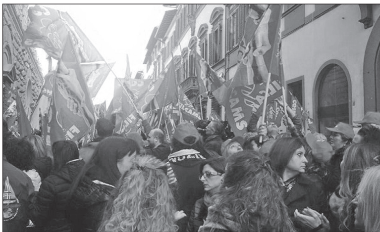
Il presidio nel centro di Firenze

I comunicati dei sindacati a livello nazionale ci parlano di percentuali altissime per gli standard del settore. In effetti, alcuni negozi non hanno aperto, in altri i padroni hanno evitato la chiusura spostando i lavoratori tra i vari punti vendita,